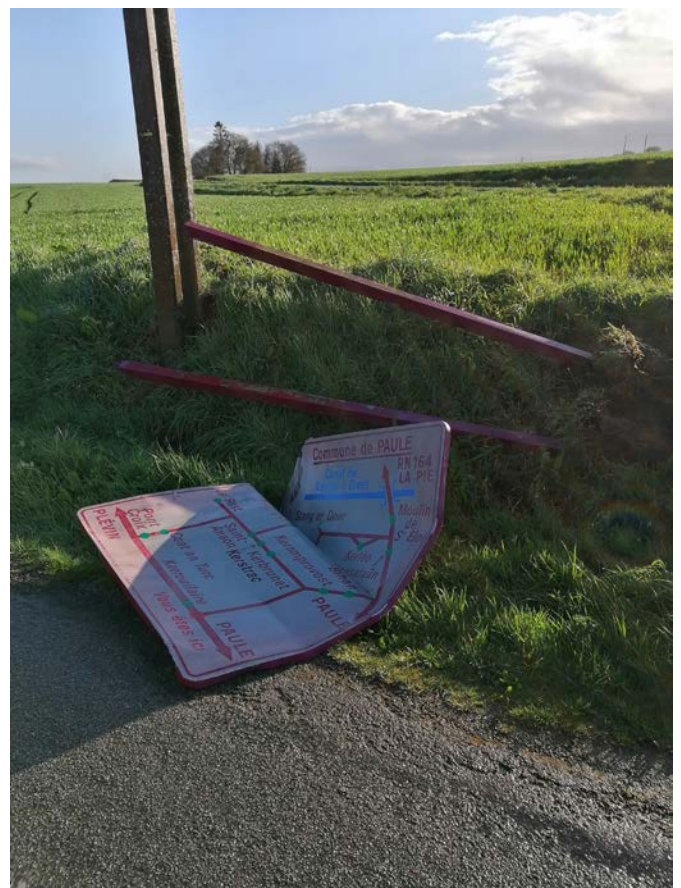
Le panneau diagrammatique situé à Kerroullaire endommagé dans la nuit du 11 avril