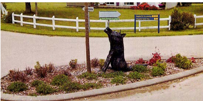
Vol du loup situé au carrefour de Croas Ty Névez