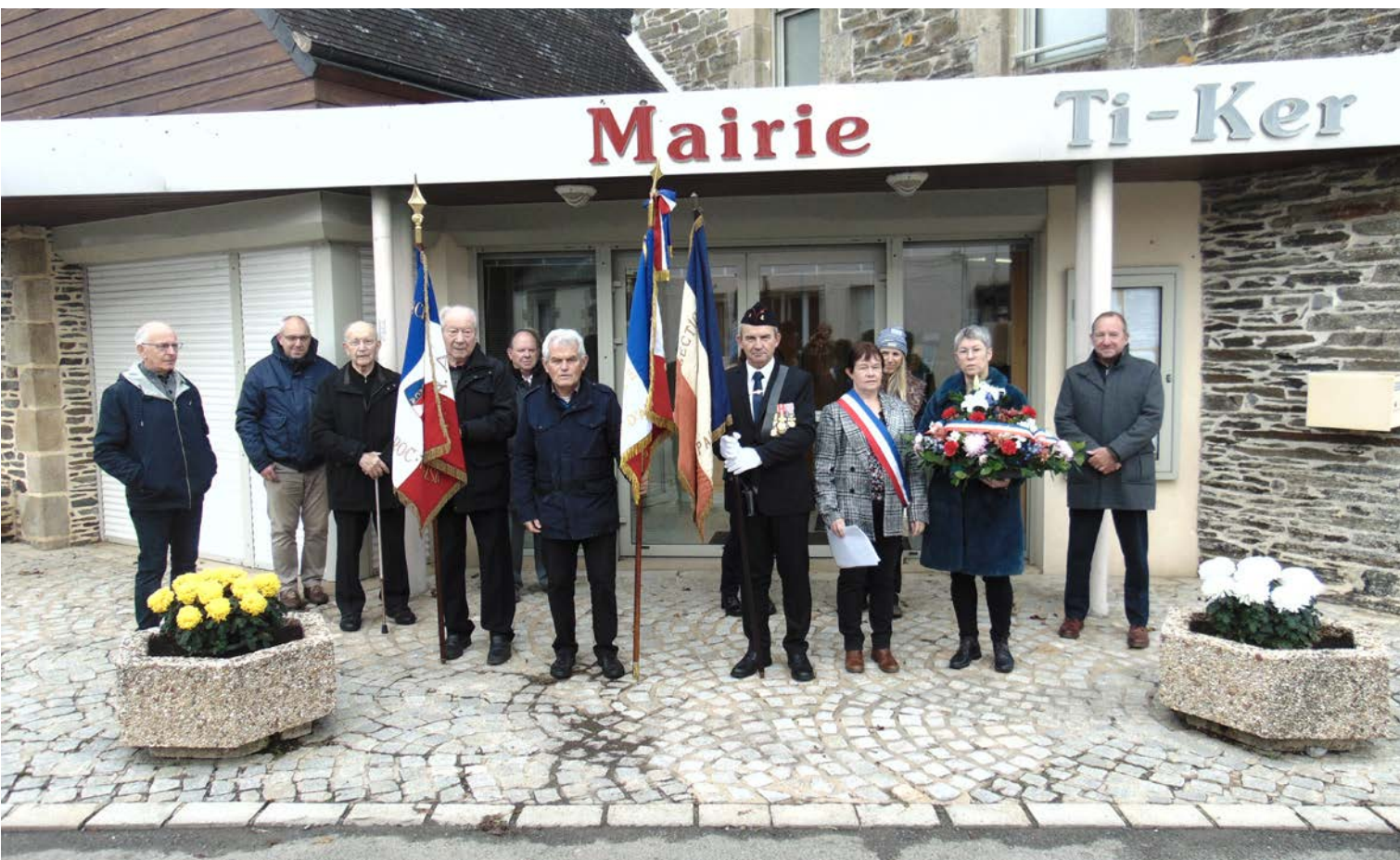
Cérémonie du 11 novembre 2023