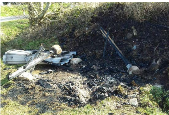
L'abri bus situé au carrefour de Bellevue incendié dans la nuit du 8 avril