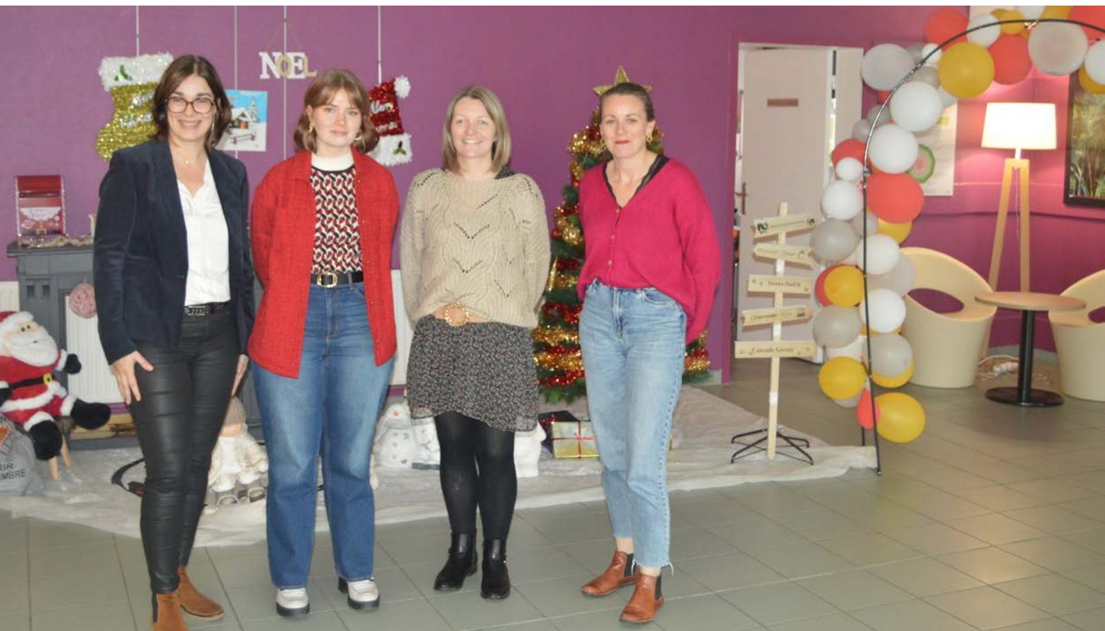
Une partie de l'équipe du CRT