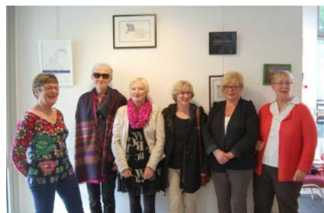
Les membres de l'atelier Calligraphie