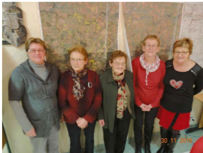
Les Membres du CCAS ont préparé les colis de fin d'année.

Les personnes âgées de 90 ans et plus qui sont à domicile ont également reçu la visite des élus.