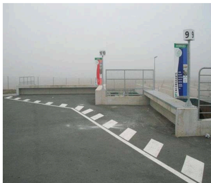
Exemple de garde-corps réalisés en béton sur un autre territoire

La CCKB va mettre en place devant chaque benne des garde-corps pour empêcher tout accident et protéger les usagers et les agents.