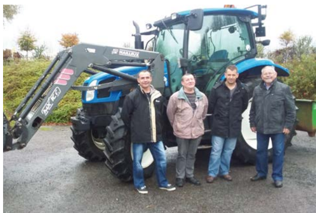
La commission voirie a réceptionné le nouveau tracteur.