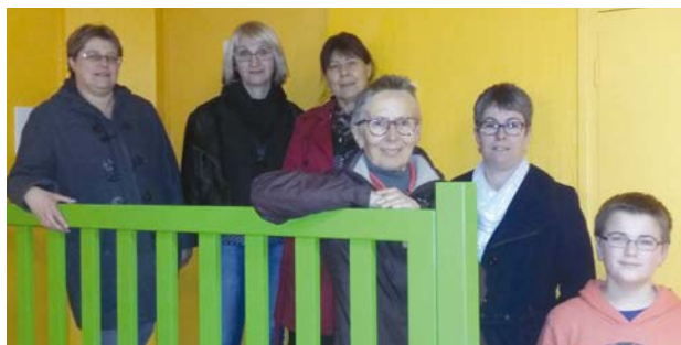
Les élèves ont choisi les couleurs.